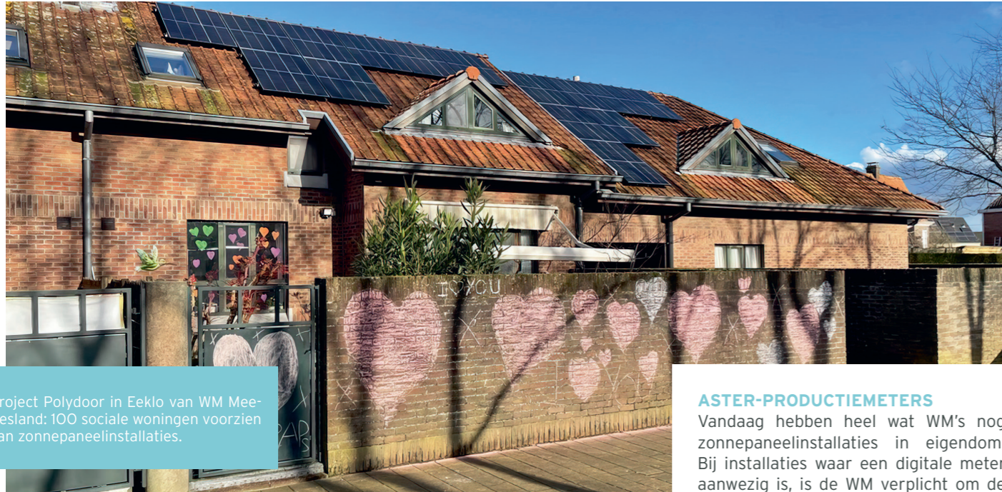
Project Polydoor in Eeklo van WM Mee-tjesland: 100 sociale woningen voorzien van zonnepaneelinstallaties.

BIJNA 80.000 ASTER- ZONNEPANELEN OP SOCIALE WONINGEN (op 31/12/23)