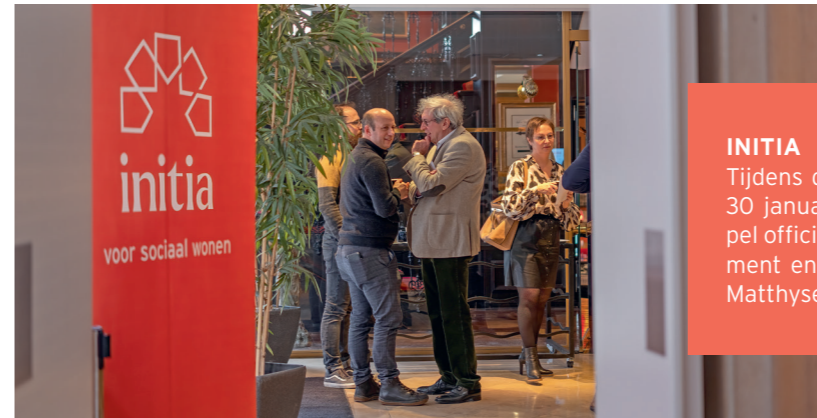
INITIA Tijdens de Buitengewone Algemene Vergadering van 30 januari zijn cruciale stappen gezet om onze koepel officieel vorm te geven. Het was een historisch moment en we delen daarom graag enkele foto's.

Ook in 2024 zal de sector geconfronteerd worden met duurzame vraagstukken. Van laadinfrastructuur en batterij-opslag, tot energiedelen of zelfs windenergie. Het blijven interessante thema's waar ASTER graag mee haar schouders onderzet. De boer ploegde en zaaide voort en de zon... die blijft gelukkig schijnen.